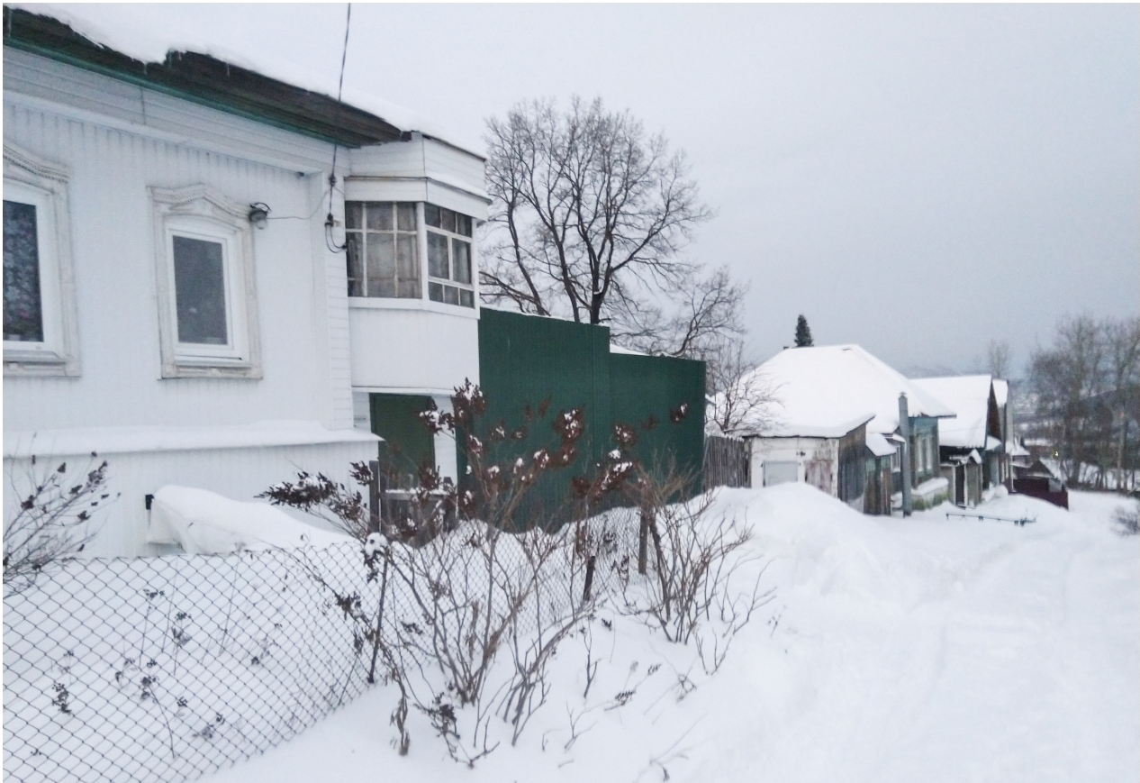
Рис. 18. Старинная застройка начала улицы 3-й Одинарной. 2023 г.

Особенности ландшафта отразила городская перепись 1917 г. — нечётные номера по 3-й Одинарной заканчивались на № 9, тогда как чётные шли до № 50 и далее. Застройка чётной стороны продолжалась вплоть до революции, последний дом по чётной стороне ещё не получил номер на момент статистического обследования. Окраинный характер улицы 3-й Одинарной сохра-