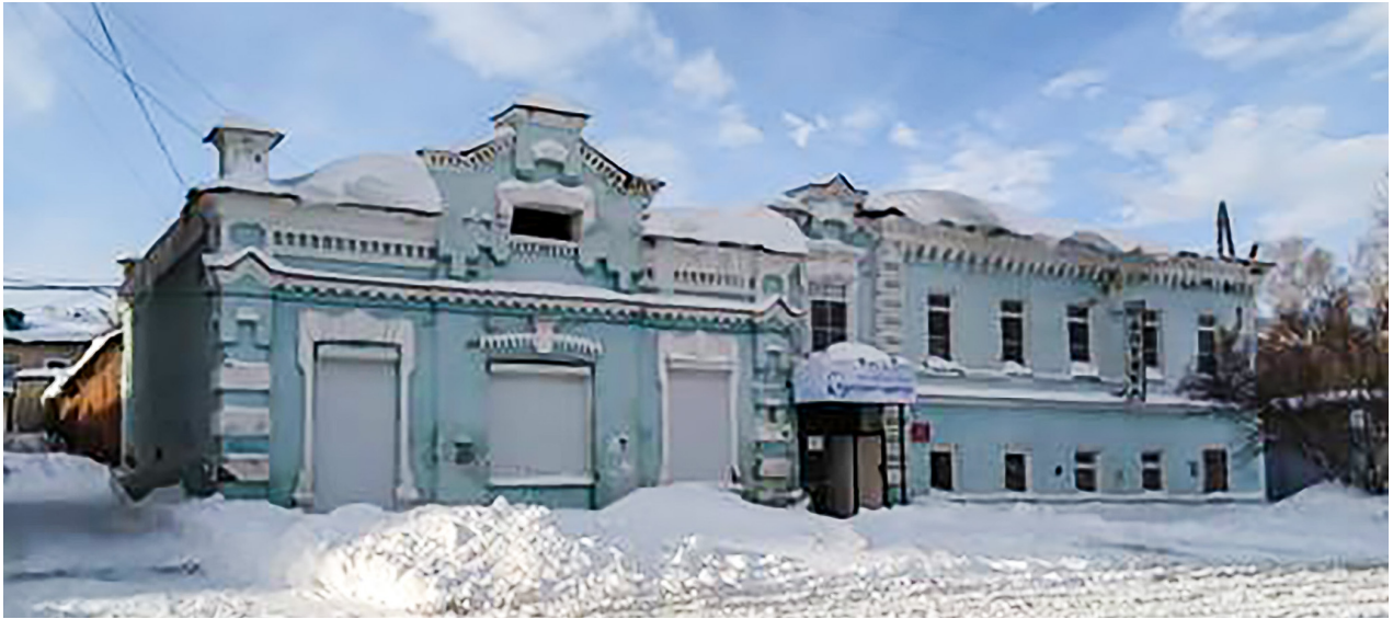
Рис. 5. Улица Ключевская, 3. 2023 г.