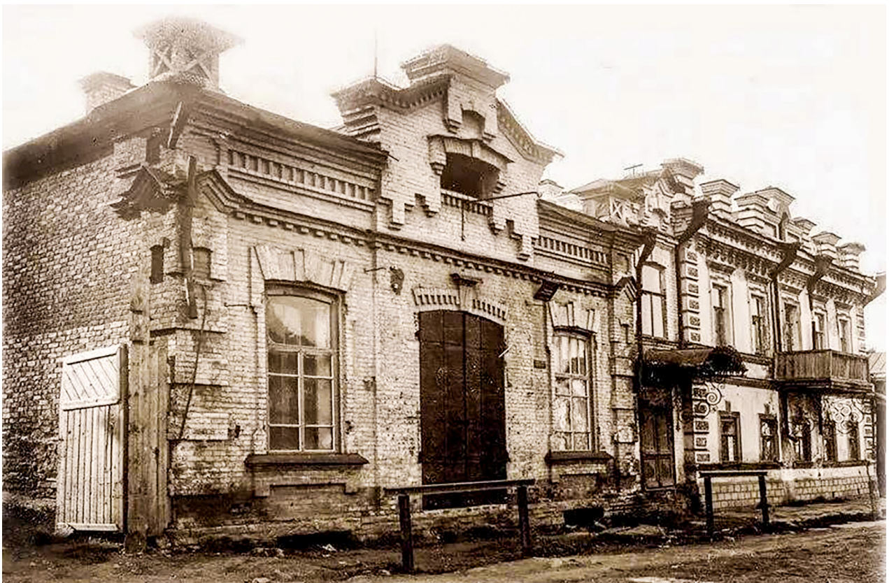
Рис. 6. Улица Ключевская, 3. 1930-е гг.