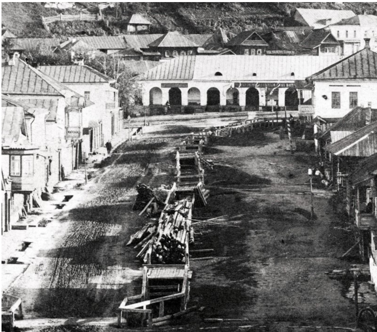
Рис. 16. Начало улицы Ключевской. Напротив — Гостиный двор. 1920-е гг. Видна реконструкция подземного отвода реки Громатухи