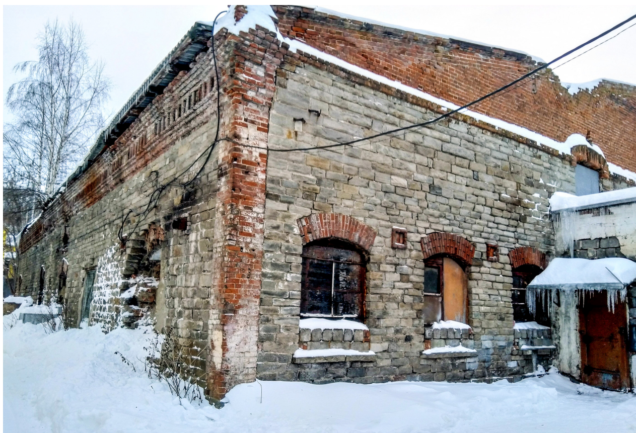
Рис. 14. Склад пивоваренной компании Видинеевых, улица Ключевская, чётная сторона. 2023 г.