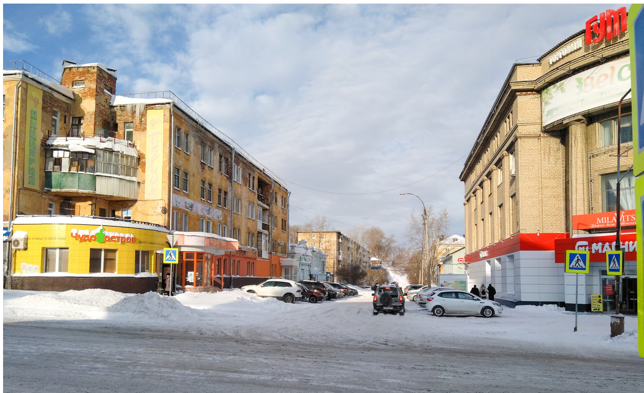
Рис. 3. Современный вид начала улицы Ключевской. 2023 г.