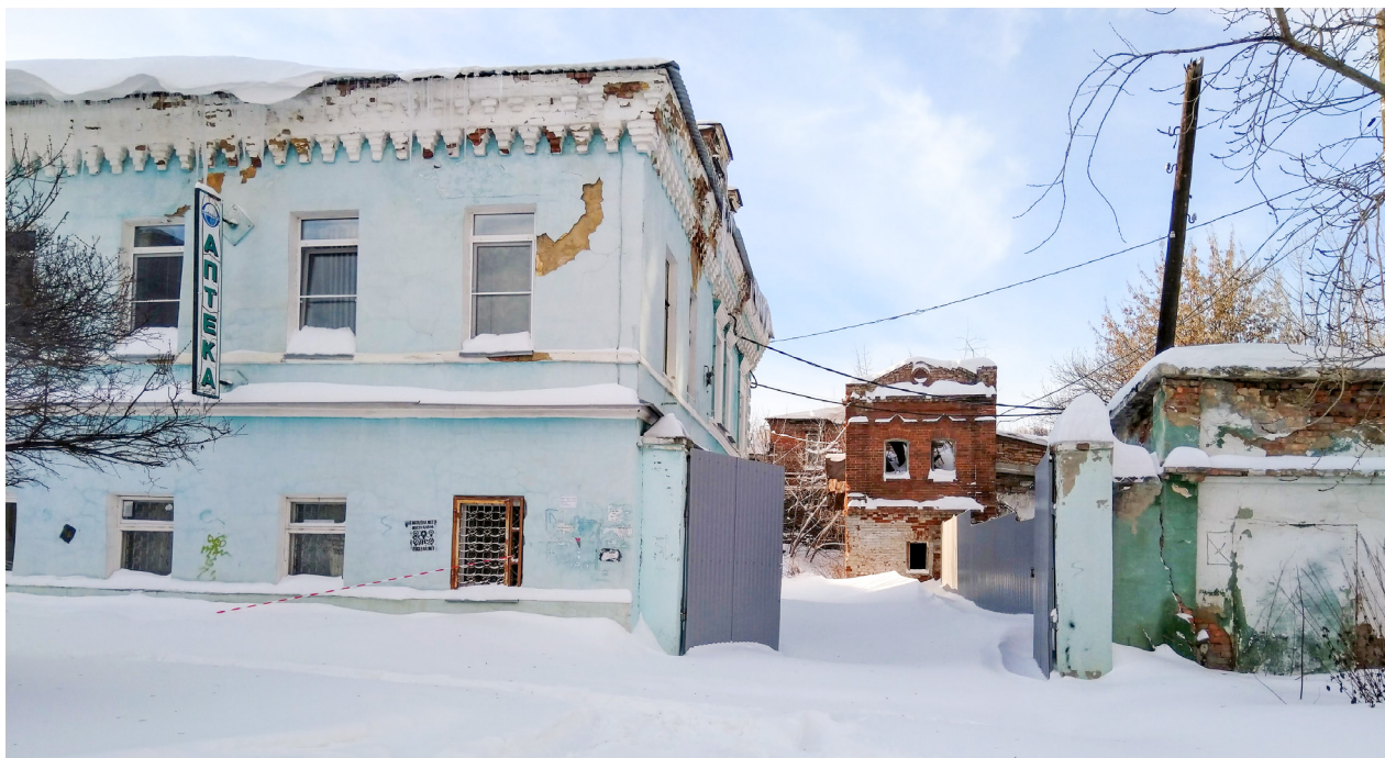
Рис. 7. Вид на хозяйственные постройки во дворе на ул. Ключевской, 3, 2023 г.