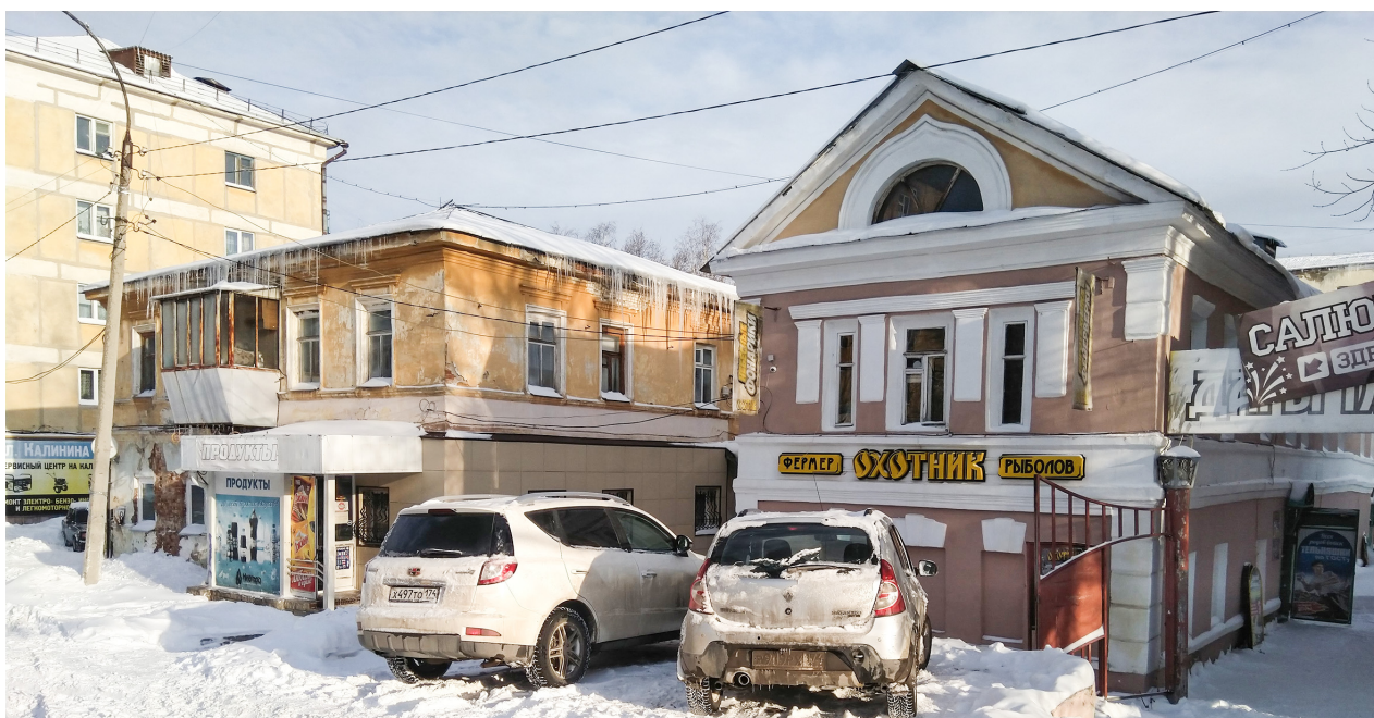
Рис. 15. Улица Ключевская, 6 и 8. 2023 г.