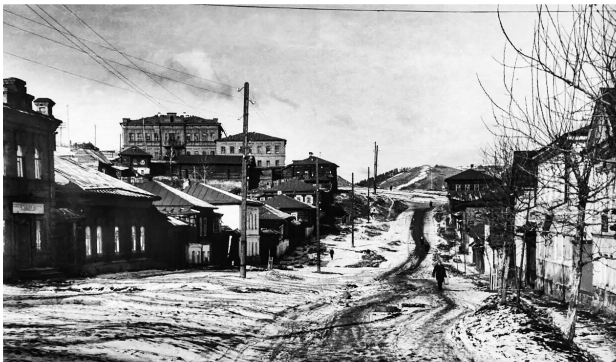
Рис. 4. Улица Ключевская. 1950-е гг.