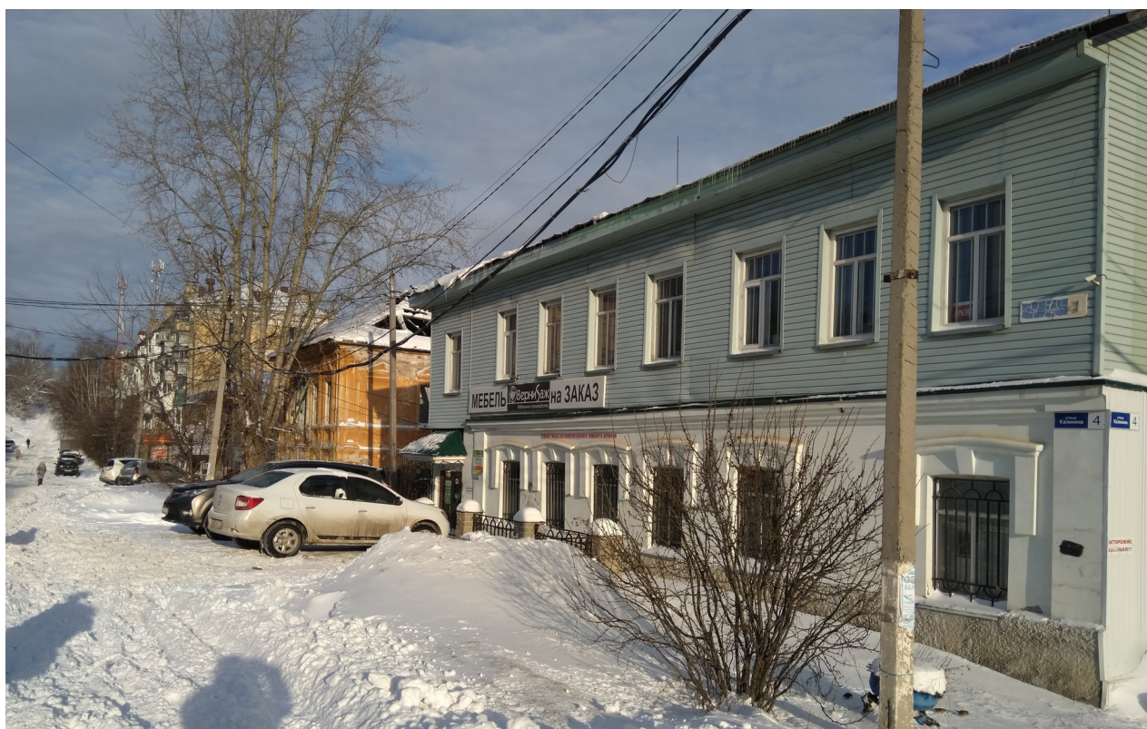
Рис. 9. Улица Ключевская, 4. 2023 г.

занская ветвь) Алкиных. Его отец Саид-Гирей Шагиахмедович Алкин (1867–1919), присяжный поверенный на 1900 г. 1 , являлся политическим деятелем, был депутатом 1-й Государственной думы.