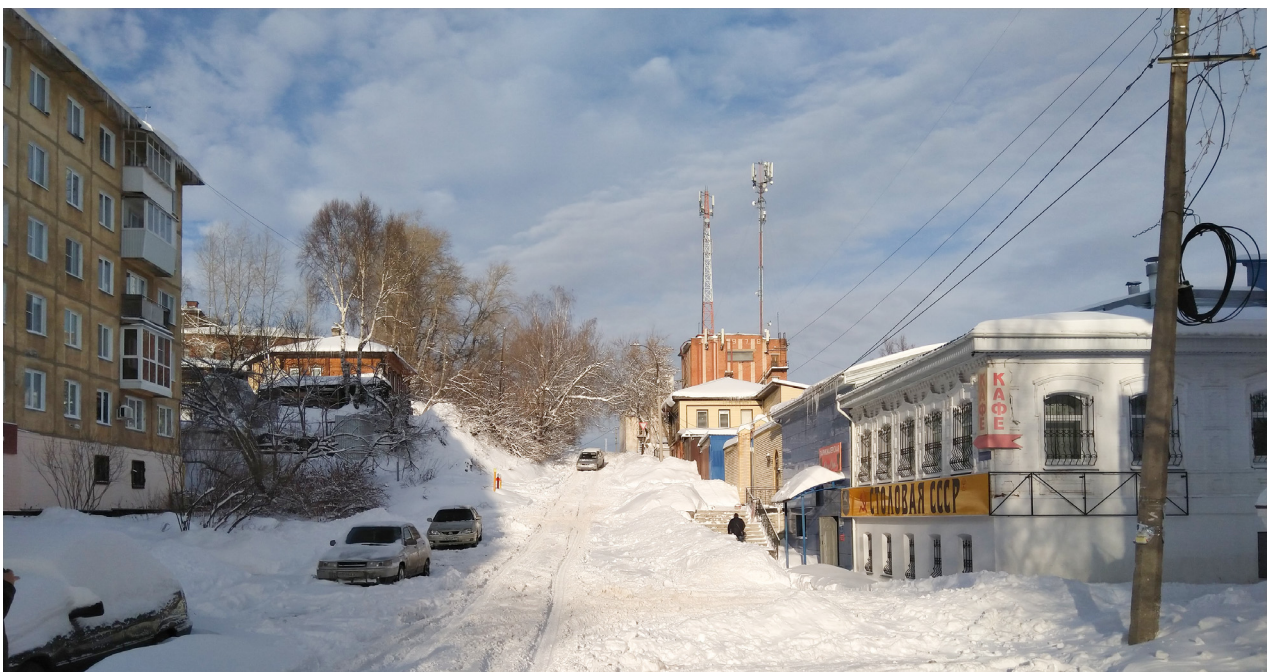
Рис. 8. Вид на чётную сторону улицы Ключевской (справа), 2023 г.