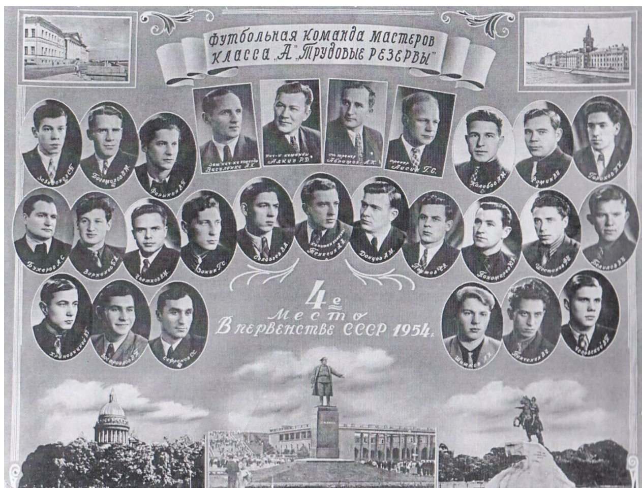
Рис. 12. Состав команды «Трудовые резервы», 1954 г.