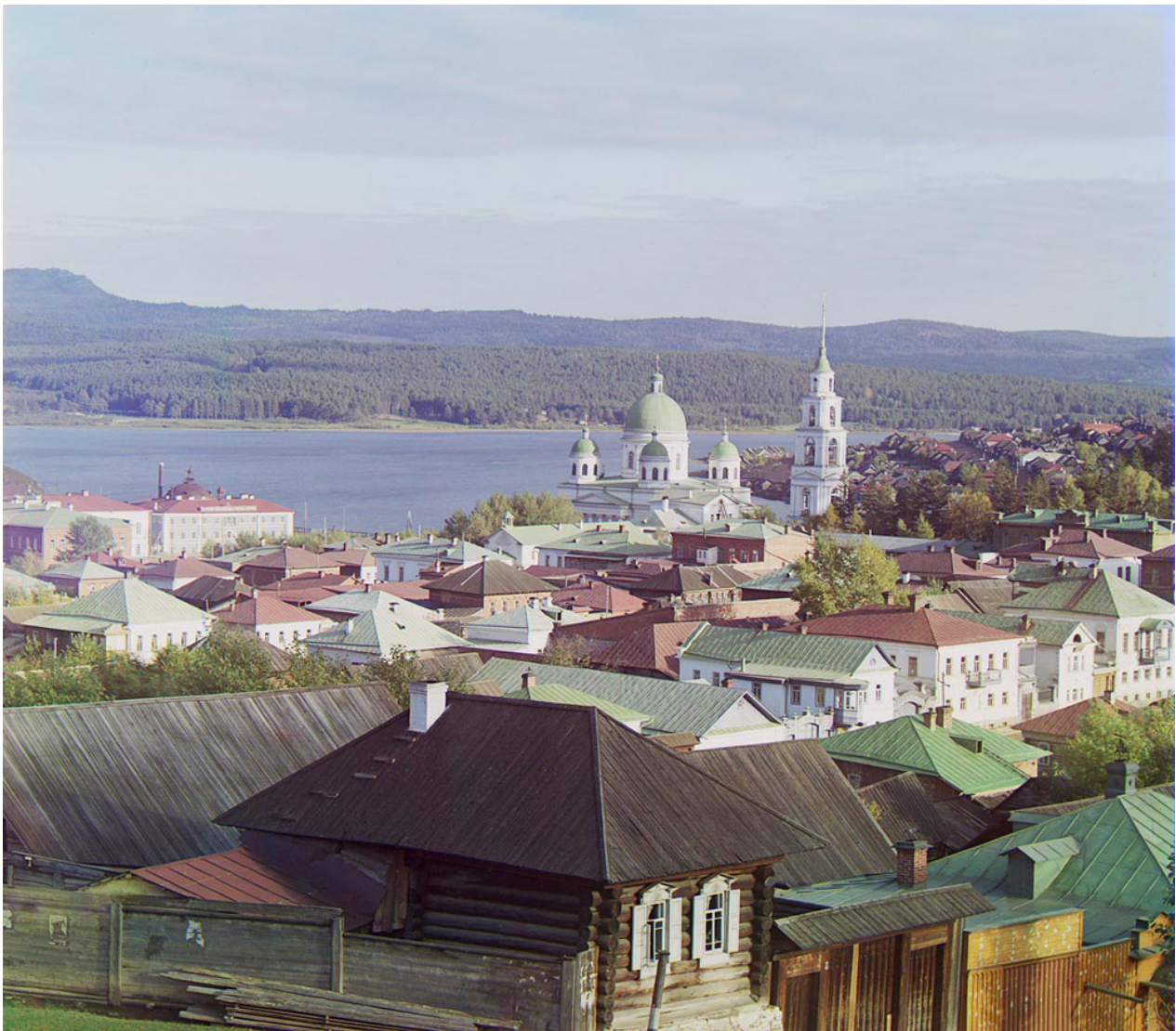
Рис. 13. С. М. Прокудин-Горский. Златоуст. 1909 г. Видны белокаменные дома № 6, 6а и 8 на улице Ключевской

Маленькая Ключевская улица даже попала на камеру самого знаменитого в Российской империи фотографа С. М. Прокудина-Горского, посетившего Южный Урал и в том числе Златоуст (рис. 13).