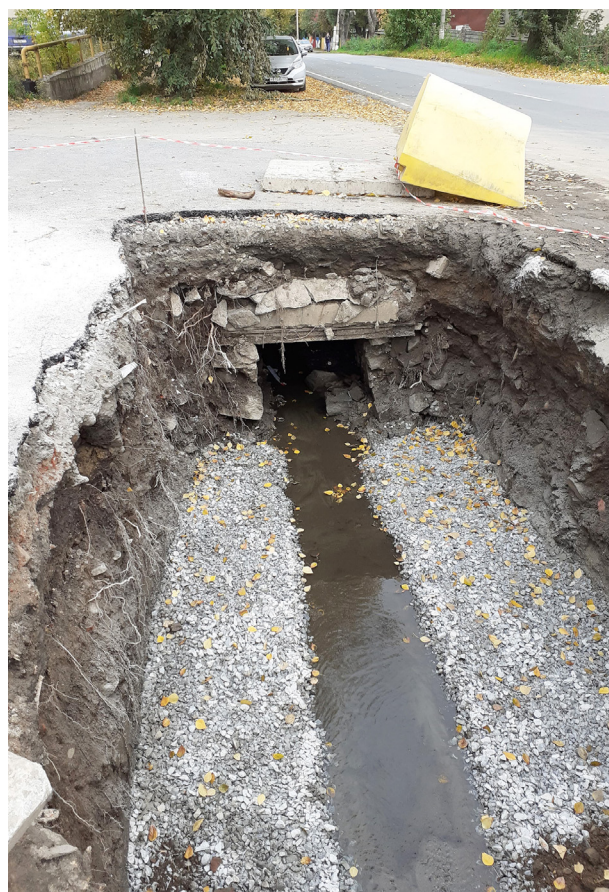
Рис. 17. Вскрытие туннеля старого русла Громатухи на соседней Златоустовской улице. Сентябрь 2023 г.

Под улицей Ключевской и соседними поныне действует система отвода воды речки Громатухи. Это уникальное инженерное сооружение, не имевшее аналога в городах Уфимской губернии. В то время как в столице региона Уфе ка-